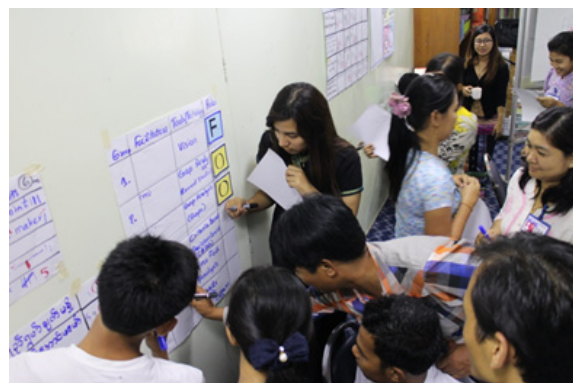
SPOT on Facilitation Workshop - 19-21 February, 2016 - 18 Participants - CBI Training Room, Yangon

According to the agreement, SPOT on Facilitation in Myanmar Version was published and CBI has been delivering SPOT on Facilitation Workshop by FNS and it will pave the way for the talented and interested Myanmar facilitators becoming internationally certified facilitator. This is a special arrangement by CBI and FNS to build up facilitation professionals who are becoming more and more important and essential for achieving the desired outcomes by the group, organizations, seminars, workshops, meeting and even in teaching. CBI conducted SPOT Facilitation workshop in Myanmar 7 times in 2014, 2015 and 2016.